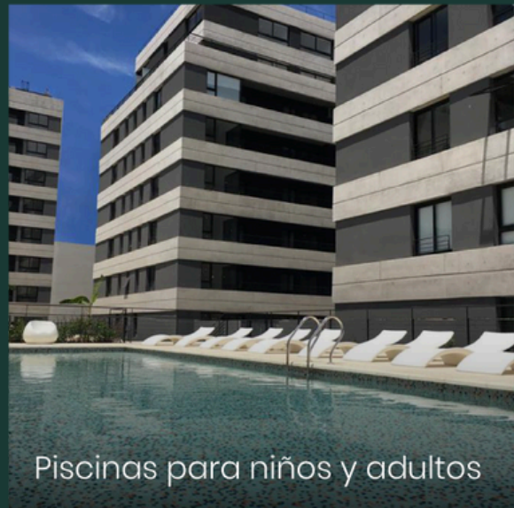
Piscinas para niños y adultos