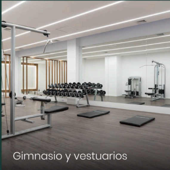
Gimnasio y vestuarios