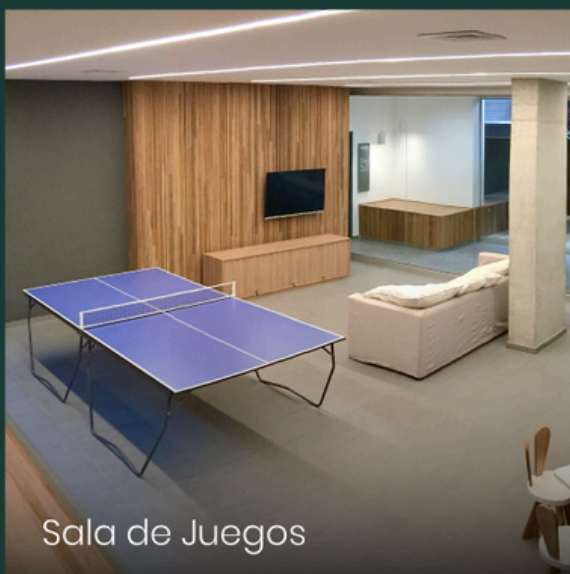
Sala de Juegos